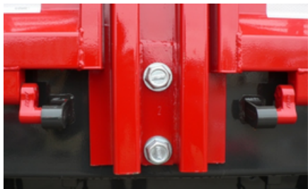
Parantes desmontables y ajustables con bulones de rosca de avance rápido.