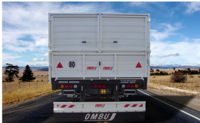
Puertas traseras tipo cerealeras.