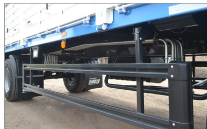
Posición opcional (consultar)