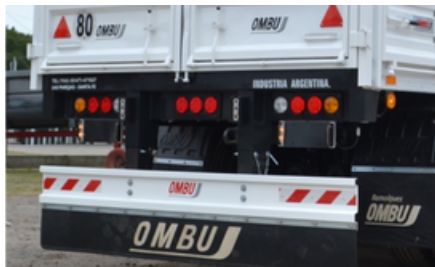
Paragolpe rebatible, volcable y desmontable. Sistema de luces de led y lámparas.