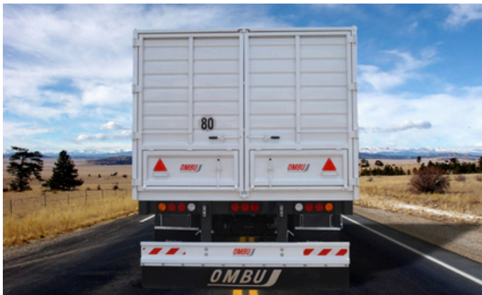
Puertas traseras tipo libro con troneras.