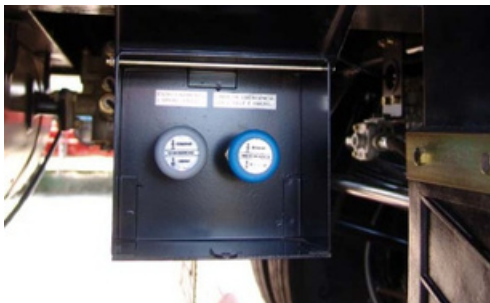
Comandos de frenos. Dispositivo para accionamiento manual de bloqueo y desbloqueo.