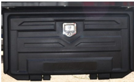
Cajón de herramientas plástico.